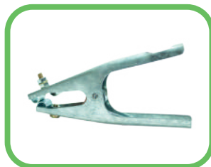
GRAPA A TIERRA