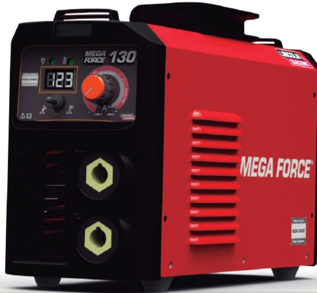
Mostrado: MEGA FORCE 130 - K69067-1