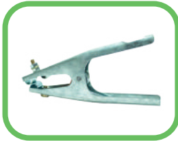
GRAPA A TIERRA